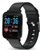
※写真のベルト色はブラックです

この度は、T-sports スマートウォッチをお買い上げ頂きありがとうございます。ご使用前にこの取扱説明書をよくお読みの上、正しくお使いください。お読みになった後は、いつでも見られるような場所に必ず保管してください。